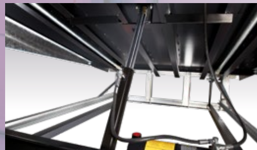
Ein hydraulischer (Haupt-) Zylinder