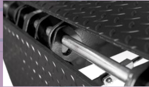
Einzigartiges offenes Lippen- scharnier