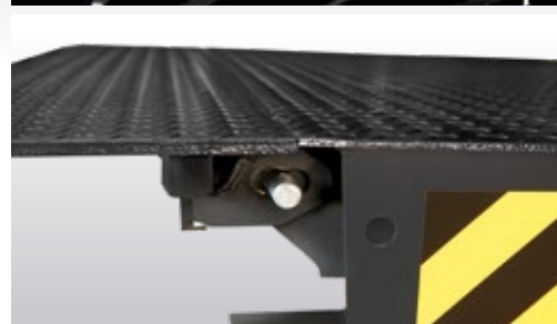
Waagerechte Lippe in allen Positionen