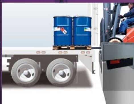
Positionierung unter Rampenniveau