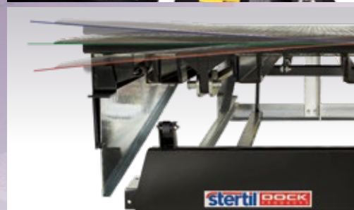
Die Plattform kann nach beiden Seiten 125 mm verwinden.