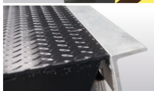
Geschlossenes hinteres Scharnier