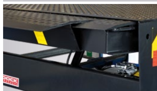
Durch seitliche Einschubzungen am Vorschub können auch schmale Lkw's mit relativ breiten Brücken bedient werden