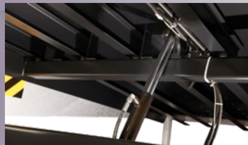
Ein hydraulischer (Haupt-) Zylinder