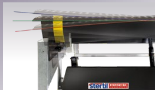
Plattform und Vorschub können um 125 mm verwunden werden