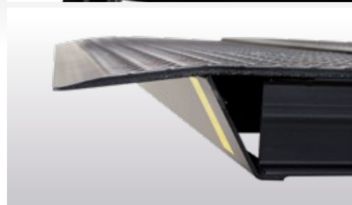
Vorschubwinkel standardmäßig 5,5°